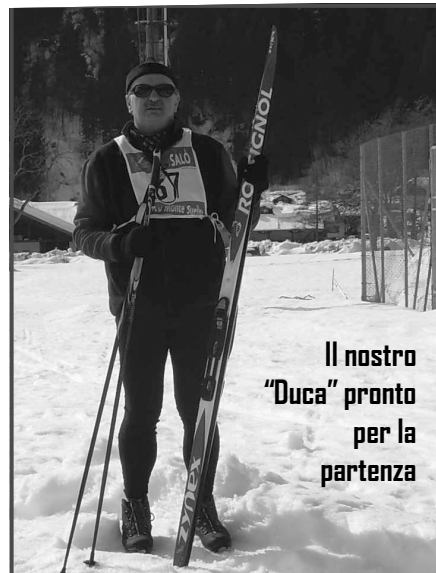
Il nostro "Duca" pronto per la partenza

Tutti gli alpini e amici del Gruppo di Salò hanno portato a termine onorevolmente la gara conquistando 99 punti per il 29° trofeo Monte Suello classificandosi al 10° posto della classifica generale.