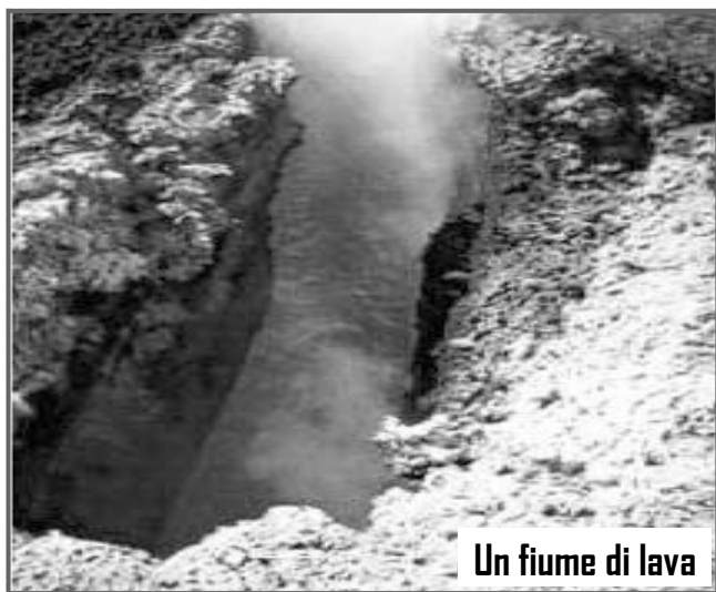
Un fiume di lava

La serata si è poi conclusa, con piena soddisfazione, sia da parte dello scrivente che di tutti i presenti, con un sobrio brindisi.