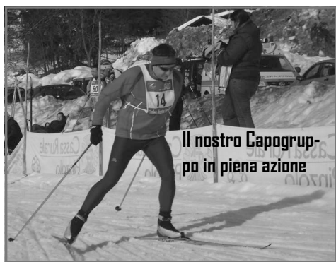
Il nostro Capogruppo in piena azione

due giri, per complessivi sei Km. sulla pista turistica Frassanida che presentava un percorso senza dislivelli e rampe tronca gambe, particolarmente adatta