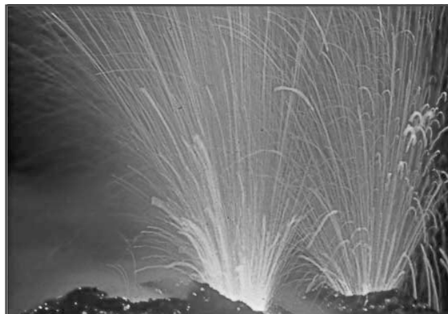
Una fase eruttiva dell'Etna